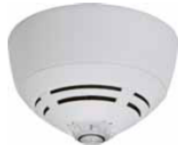
IQ8Wireless Gateway med IQ8Quad detektor